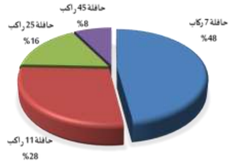
الشكل 5: نوع وسيلة النقل المفضلة لدى الطلاب وأولياء المرور