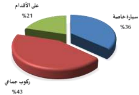
الشكل 3: وسائل النقل المستخدمة في التنقل بين المنزل والمدرسة

يعتمد الطلاب وأولياء الأمور في تنقلاتهم على السيارة الخاصة إضافة إلى نمط من النقل الجماعي الذي يتم بالاتفاق مع سائق يمتلك مركبة أو حافلة صغيرة. وكما هو مبين في الشكل 3 فإن نسب توزيع الطلاب على وسائل النقل الخاص والنقل الجماعي هي على التوالي 36% و43%. وأما باقي النسبة من الطلاب 21% فيذهبون إلى المدارس مشياً على الأقدام أو ربما ينتقلون مع زملائهم في سارة أحد الجيران أو الأقارب.