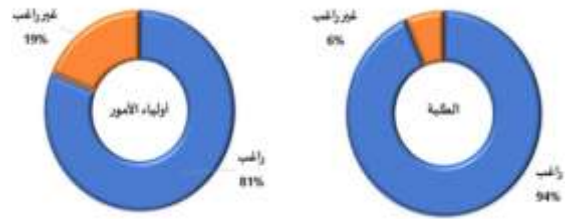
الشكل 4: الرغبة في استخدام النقل العام والجماعي

أقصى سعر نقل مفضل = x_6 ، حجم الأسرة = x_5 ، متوسط الدخل = x_4